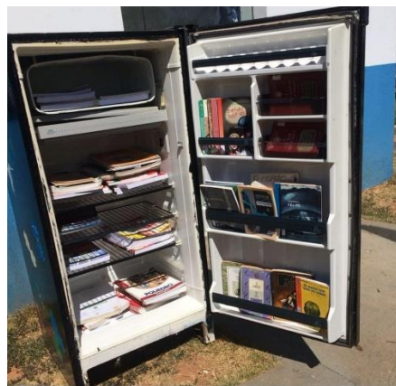
Figura 1: Geladeira estilizada para confecção da Geloteca, realizada pelo PET Bio.